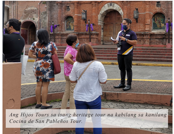
Ang Hijos Tours sa isang heritage tour na kabilang sa kanilang Cocina de San Pablenos Tour .

Tour. Ang programang ito ay kombinasyon ng isang heritage tours na tinatawag na Hijos de Siete Lagos at isang culinary tour na nagpapakita ng mga kakaibang pagkain sa lungsod. Nagsimula ang tour sa isang suman demo na nagpapakita ng kahalagahan ng muling pagsasagawa ng mga pamanang pamamaraan ng pagluluto.